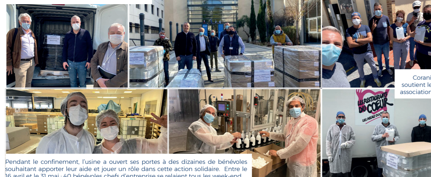
Corania soutient les associations

Dons à l'IHU Méditerranée Infection et à l'AP-HM